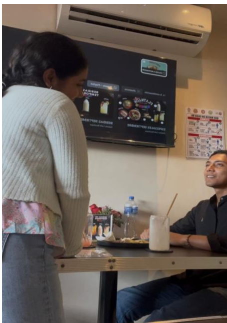
Evidencia fotográfica tomada a uno de los tres clientes entrevistados, (antes de entrevistarlos se les pidió el consentimiento para tomar una fotografía, pero solo un cliente dio la autorización).