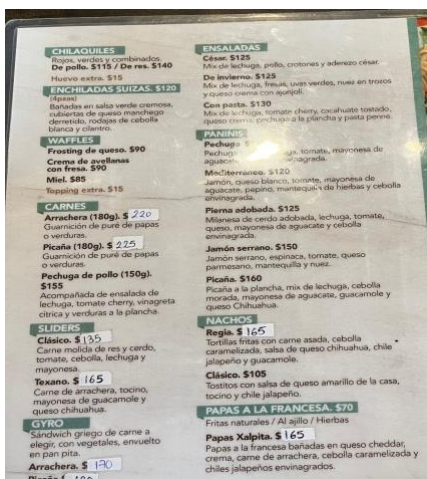
Evidencia tomada del menú.