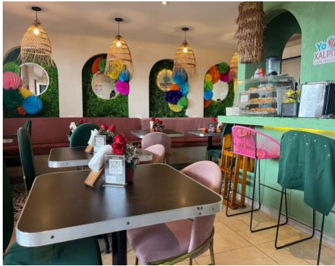
Fotografía tomada al ingresar a la cafetería.